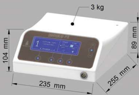
MUN.PZ - Classic version (no led)